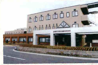
美幌町立国民健康保険病院