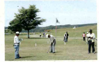
河畔公園パークゴルフ場