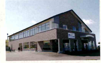
道の駅ぐるっとパノラマ美幌峠