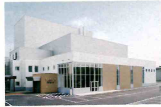
美幌町民会館「びほーる」