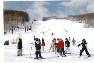
リリー山スキー場