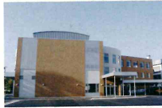
しゃきっとプラザ

オホーツク海沿岸と北見内陸地帯の中間に位置し、オホーツク海流・海霧・流水の影響を受けやすく、夏には一時高温を記録するものの年間を通すと冷涼な気候で、降水量も道内では最も少なく、日照時間の長さは国内有数の地域。