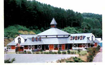
グリーンビレッジ美幌