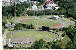
柏ヶ丘陸上競技場・野球場