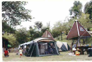
みどりの村森林公園キャンプ場