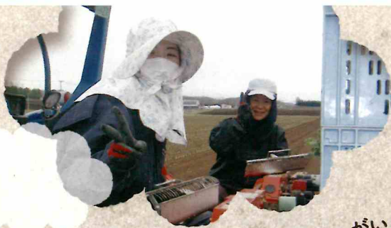
じゃがいもの収穫